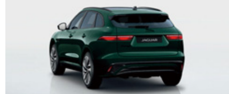
特別仕様車価格 (消費税込) ¥10,420,000