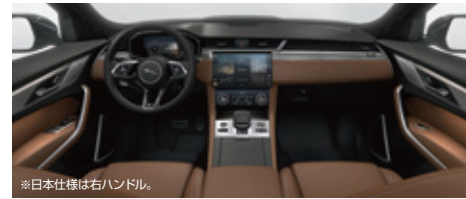
※日本仕様は右ハンドル。

インテリアカラー: シエナタン/パーフォレイトッドグレイレザースポーツシート (エボニー/シエナタンインテリア)