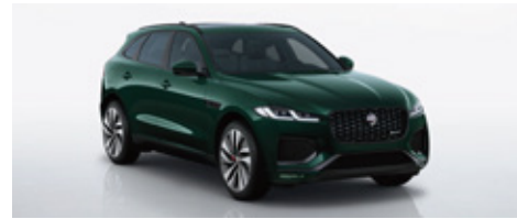
※インテリアカラーはエボニー/シエナタン。

エクステリアカラー: プリティッシュレッシンググリーン SVOウルトラメタリック (グロスフィニッシュ) 限定15台