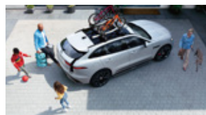
コンビニエンスバック