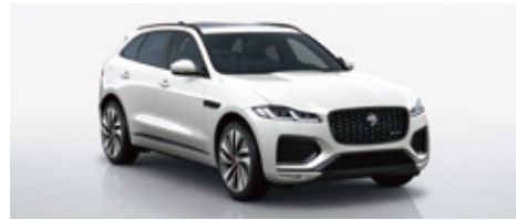
※インテリアカラーはエボニー/シエナタン。

エクステリアカラー: アイシーホワイト SVOスペシャルエフェクト (グロスフィニッシュ) 限定10台