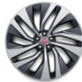
21インチ"スタイル1068"10スポーク (サテンダークグレイ コントラストダイヤモンドタンド)

ベース車両: F-PACE R-DYNAMIC SE P250 特別装備 (F-PACE R-DYNAMIC SEに下記の装備を追加) ■スライディングパノラミックルーフ ■フルフレール (グロスブラック) ■ブラックエクステリアパック ■プライバシーガラス ■ピクセルLEDヘッドライト (シグネチャーDRL付) ■フロントフォグランプ ■21インチ"スタイル1068"10スポーク (サテンダークグレイコントラストダイヤモンドタンド) ■リアシートリモートリリースレバー ■16ウェイ電動フロントシート (ヒーター&ベンチレーション、メモリー、2ウェイマニュアルヘッドレスト付) ■ステアリングホイール (ヒーター付) ■シエナタン/パーフォレイトッドグレイレザースポーツシート (エボニー/シエナタンインテリア) ■ハンズフリーパワールーフブラインド ■MERIDIAN™サラウンドサウンドシステム ■ワイヤレスデバイスチャージング ■パークアシスト ■ダイナミックハンドリングパック - コンフィギュラブルダイナミクス、アダプティブダイナミクス、ブレーキキャリパー (レッド) ■コンビエンスバック - パワーシエスチャーテルゲート、追加電源ソケット、アクティブイキ 主要諸元 ●全長×全幅×全高: 4,755mm×1,935mm×1,665mm ●乗車定員: 5名 ●右ハンドル ●8速AT ●AWD ●エンジン: 1,995cc i4 INGENIUM ターボチャージドガソリン、最高出力250PS、最大トルク365N・m