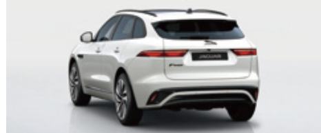
特別仕様車価格 (消費税込) ¥10,800,000