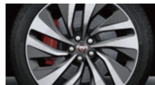
ブレーキキャリパー (レッド)