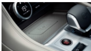
ワイヤレスデバイスチャージング ルーフブラインド